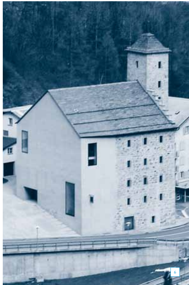
4-6 Abb. auf dieser Seite: Beim Turm setzt sich der ergänzte Teil dank des gestockten Betons deutlich vom Bestand ab.